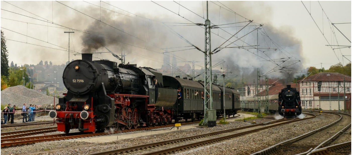
50 2988 und 52 7596 bei der Parallelausfahrt aus dem Bahnhof Rottweil am 20.09.2014